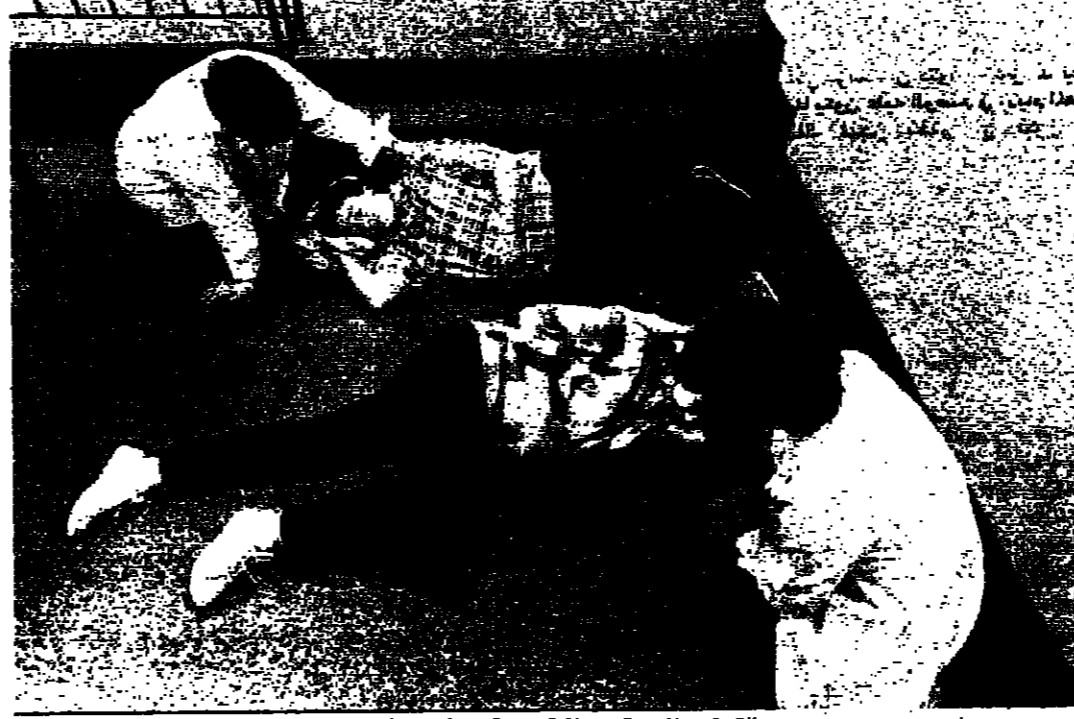
التحضر للامومة - رياضة يومية وتنفس وانتظار